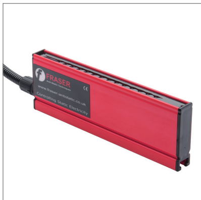
7160 Генеруюча шина